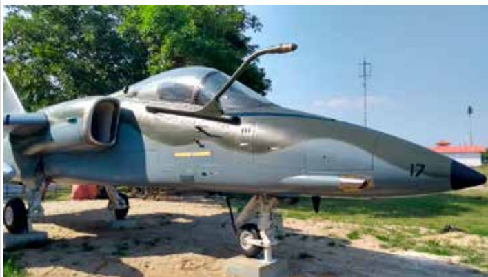
O Aeritalia/Aermacchi/Embraer AMX

Seja bem-vindo ao Clube e obrigado por servir ao nosso País!