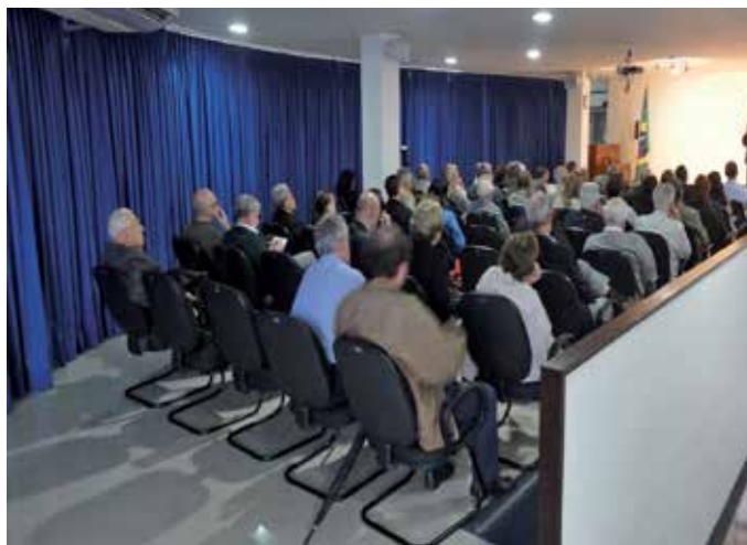
Salão de Convenções Marechal Márcio de Souza e Melo

Caso o contratante prefira não utilizar o bufê e a decoração das empresas conveniadas com o Clube, serão cobradas as taxas da tabela existente no Dep. Social, pela utilização do espaço e dos equipamentos das referidas empresas.